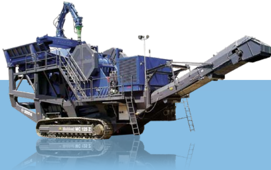
Seitenansicht MC 125 Z Betriebsstellung