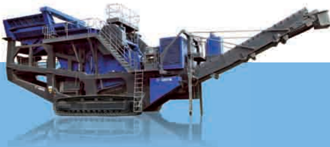
Схема 140 Z в рабочем положении