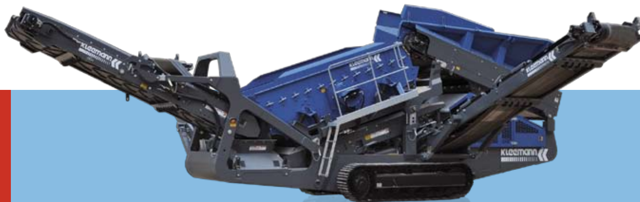
Схема MS 12 Z-AD в транспортном положении