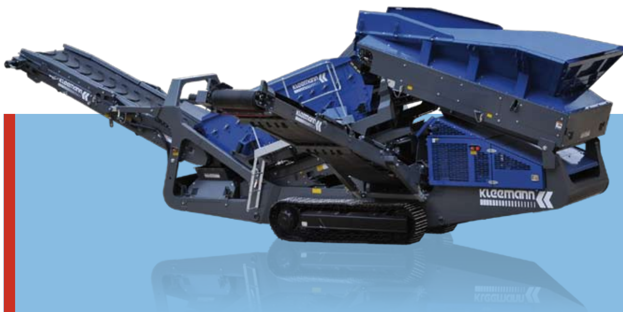
Схема MS 13 Z-AD в транспортном положении