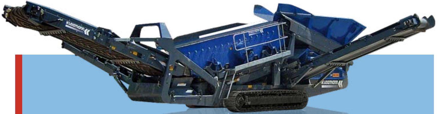
Vista lateral MS 15 Z en posición de transporte