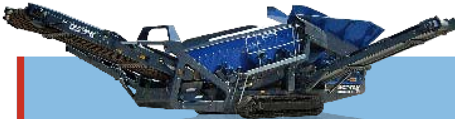
Widok z boku MS 15 Z Pozycja transportowa