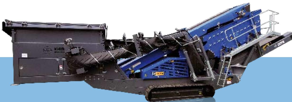
Widok z boku MS 16 D Pozycja transportowa