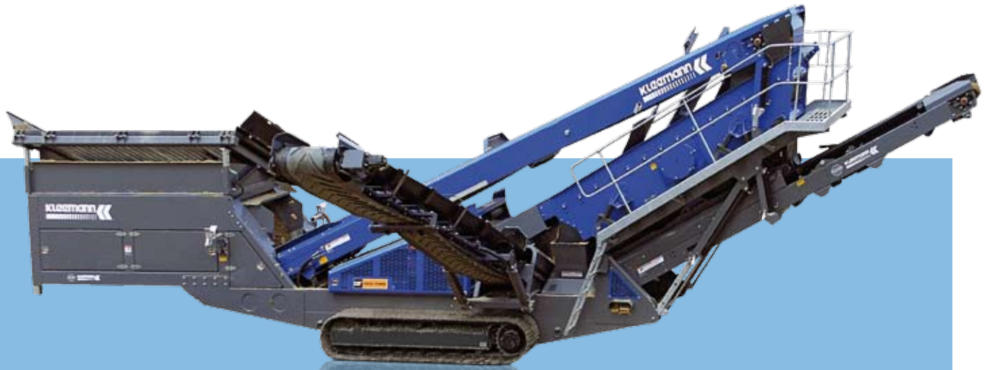
Vista lateral M 16 Z en posición de transporte