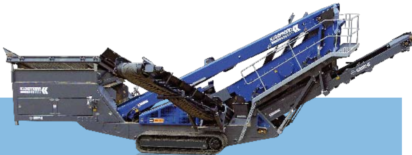
Widok z boku MS 16 Z Pozycja transportowa