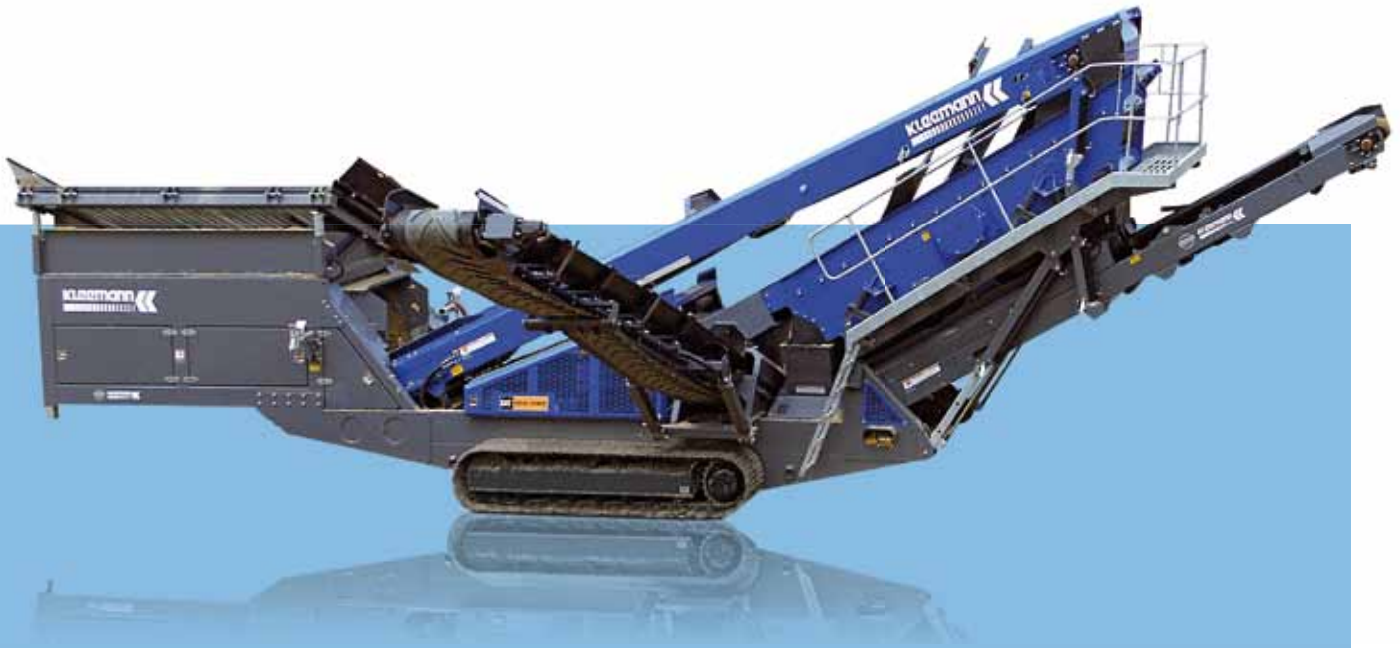
Схема MS 16 Z в транспортном положении