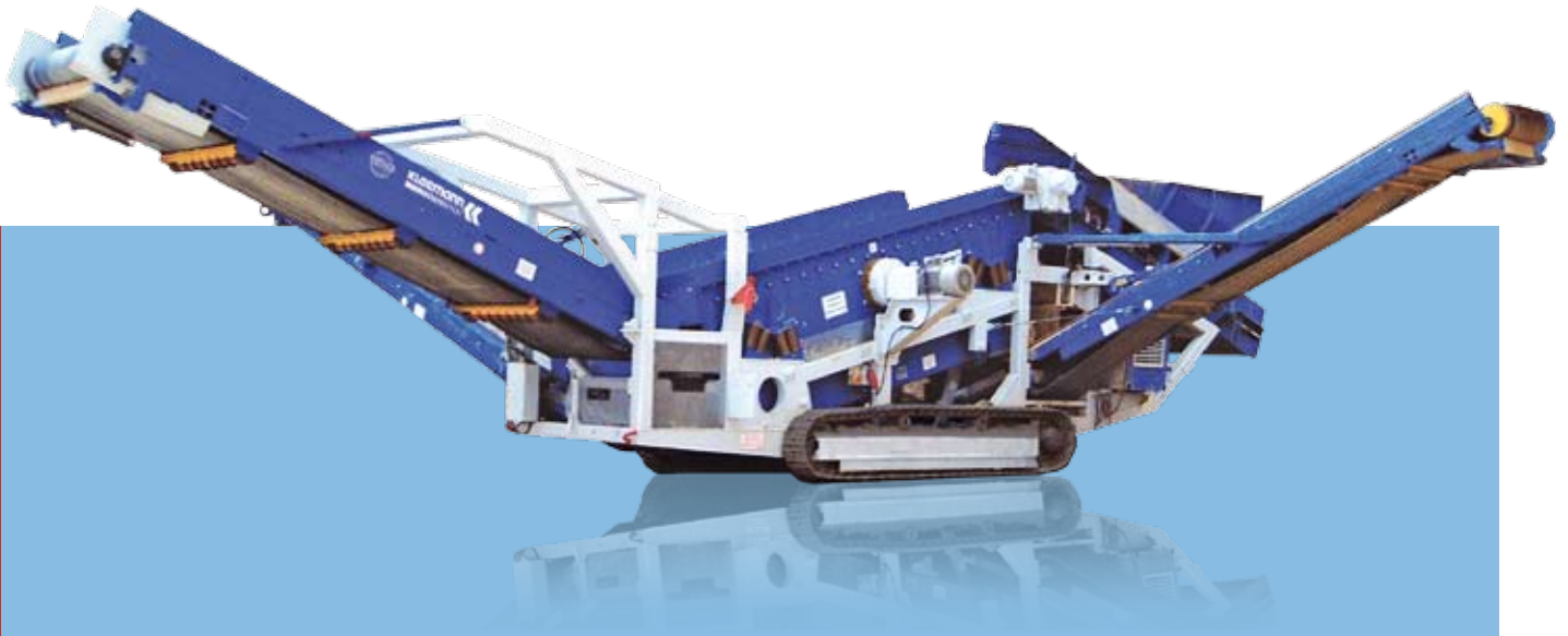
Vista lateral MS 18 Z