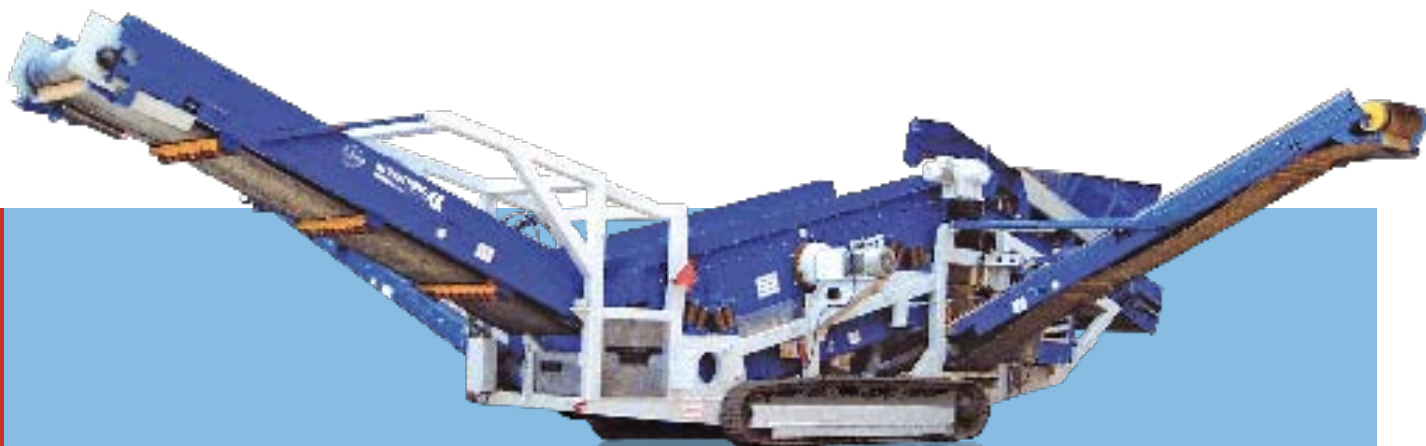
Widok z boku MS 18 Z