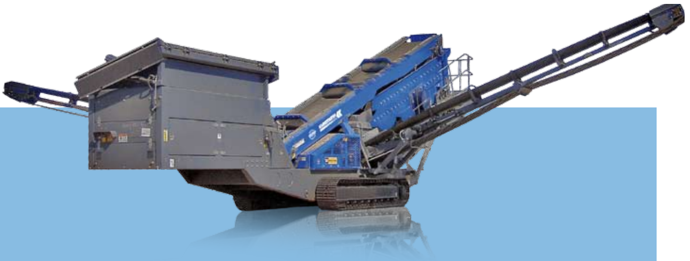
Vista lateral MS 19 D en posición de transporte