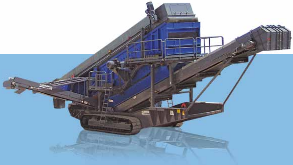
Схема MS 20 D