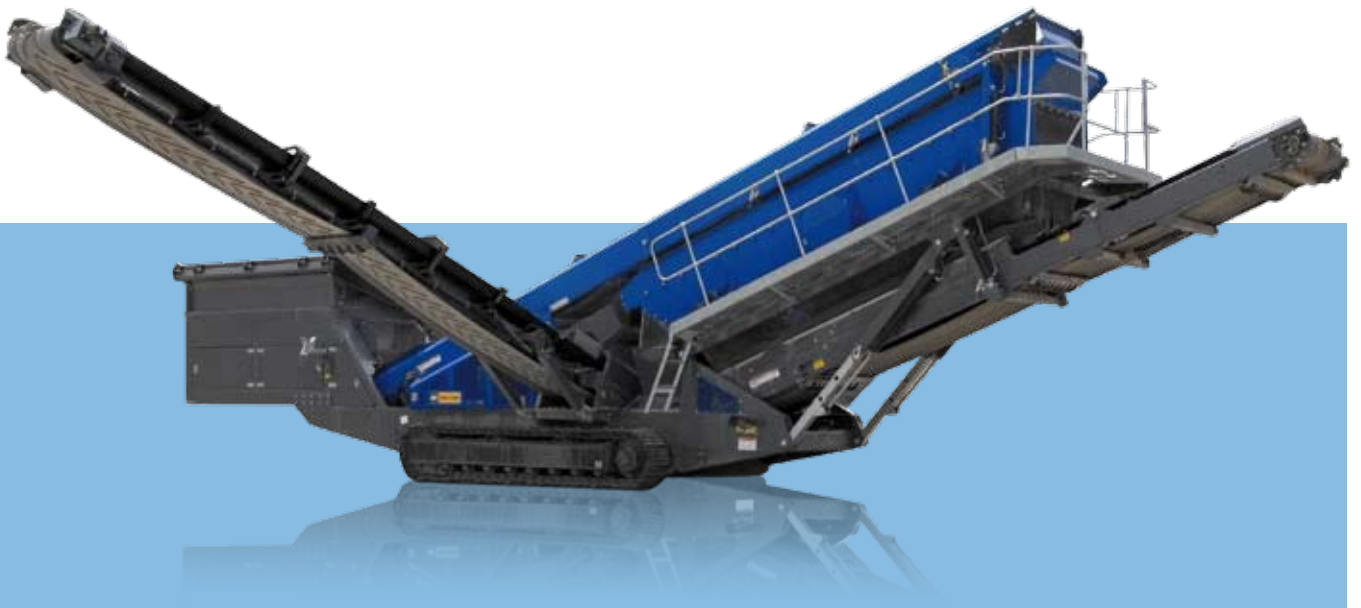
Vista lateral MS 19 Z en posición de transporte