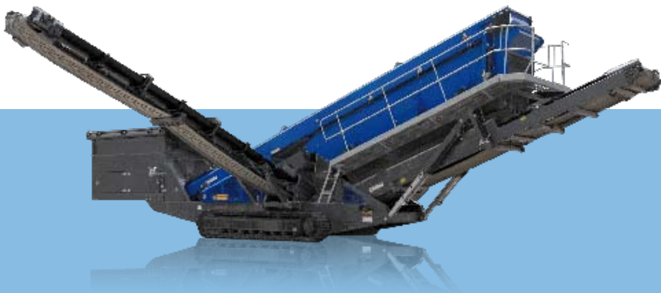
Widok z boku MS 19 Z Pozycja transportowa