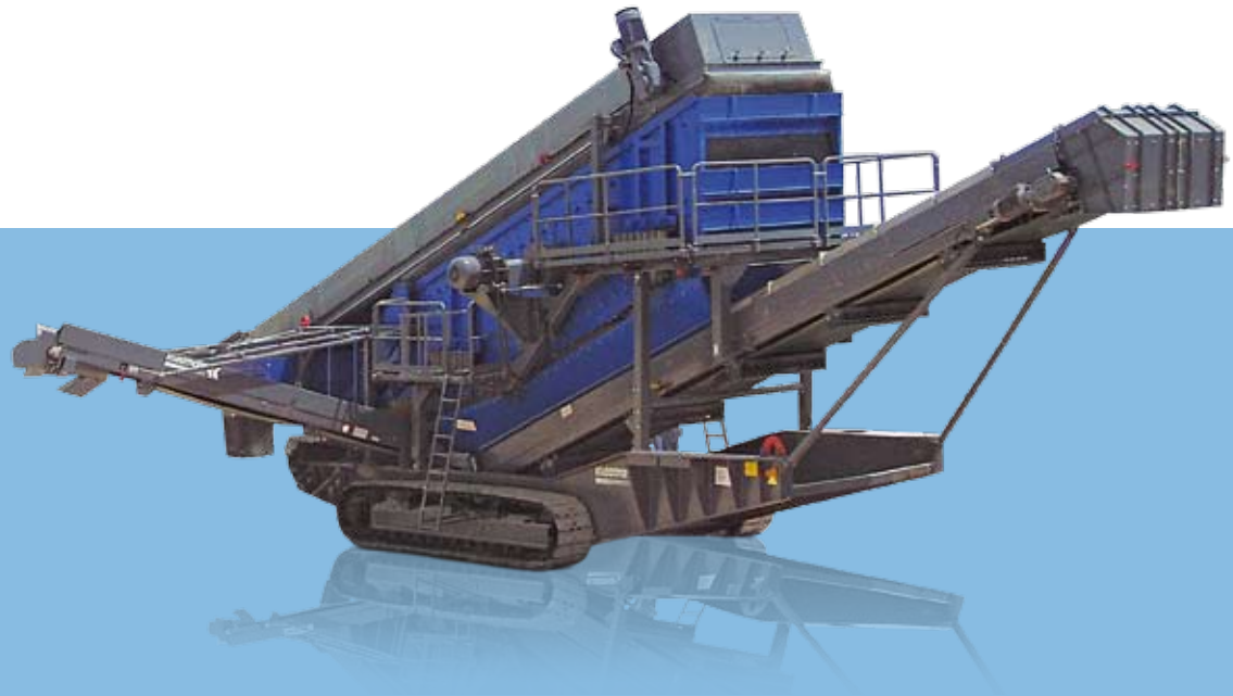
Vista lateral MS 20 D