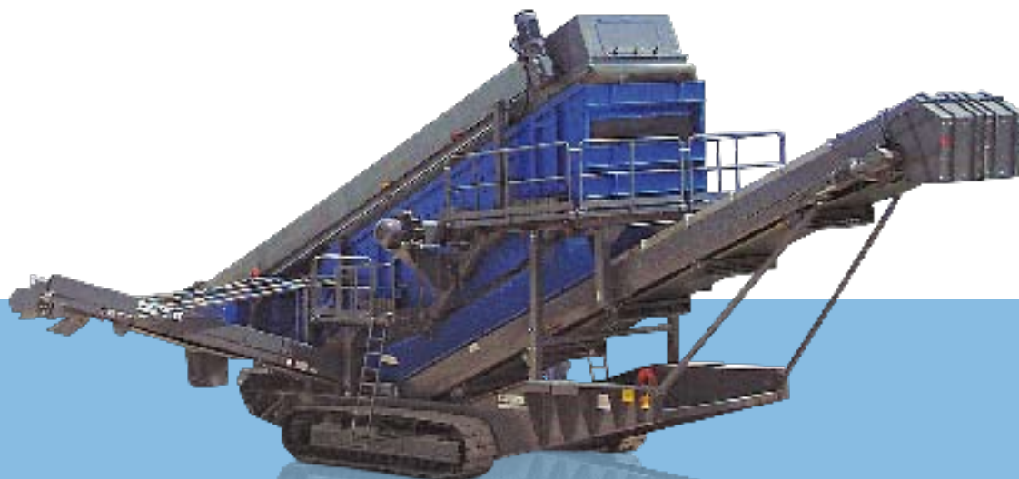
Widok z boku MS 20 D