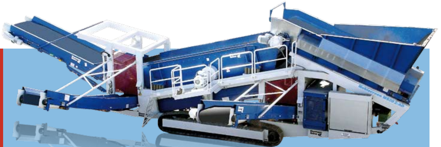
Seitenansicht MS 20 Z